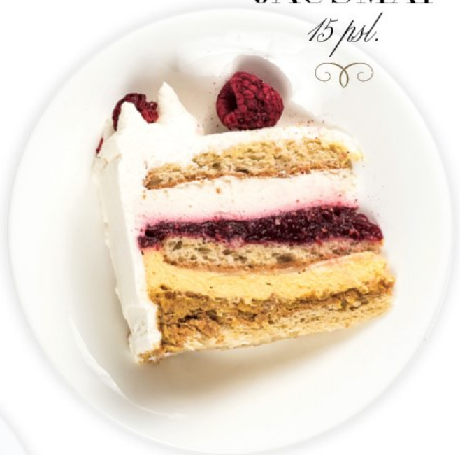
CITRININIAI JAUSMAI 15 psl.