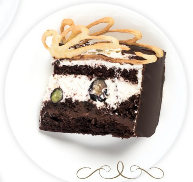
MASKARPONĖ 11 psl.