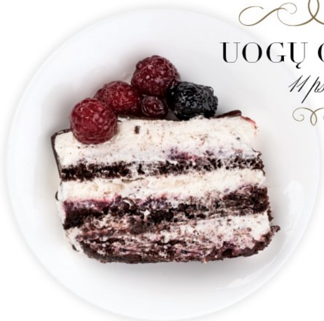
UOGŲ GAIVA 11 psl.