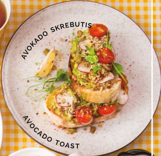
AVOKADO SKREBUTIS AVOCADO TOAST