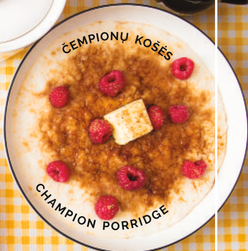
ČEMPIONŲ KOŠĖS CHAMPION PORRIDGE