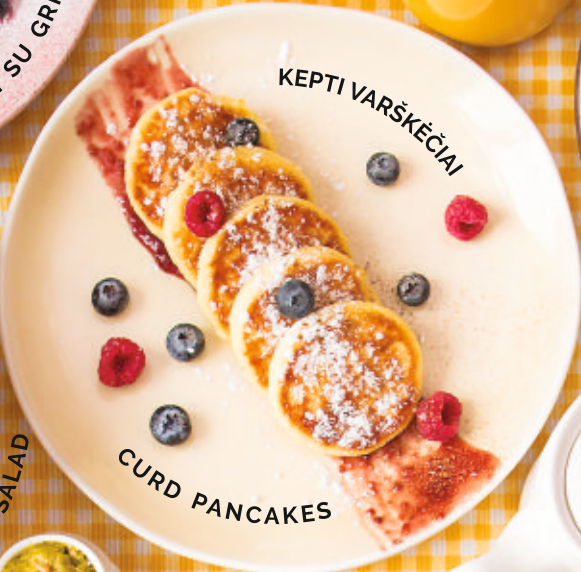
KEPTI VARŠKĖČIAI CURD PANCAKES