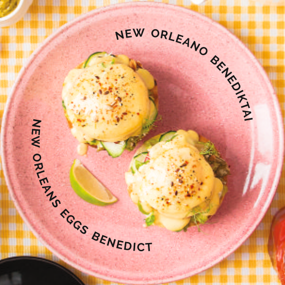
NEW ORLEANO BENEDIKTAI NEW ORLEANS EGGS BENEDICT