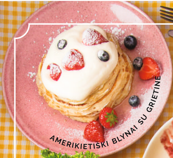
AMERIKIETISKI BLYNAI SU GRIETINE