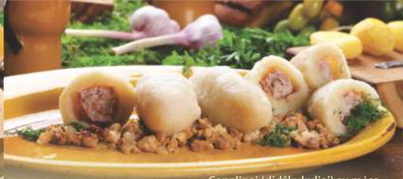
Cepelinai (didžkukuliai) su mėsa