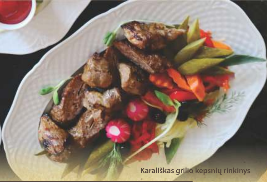
Karališkas grilio kepsnių rinkinys