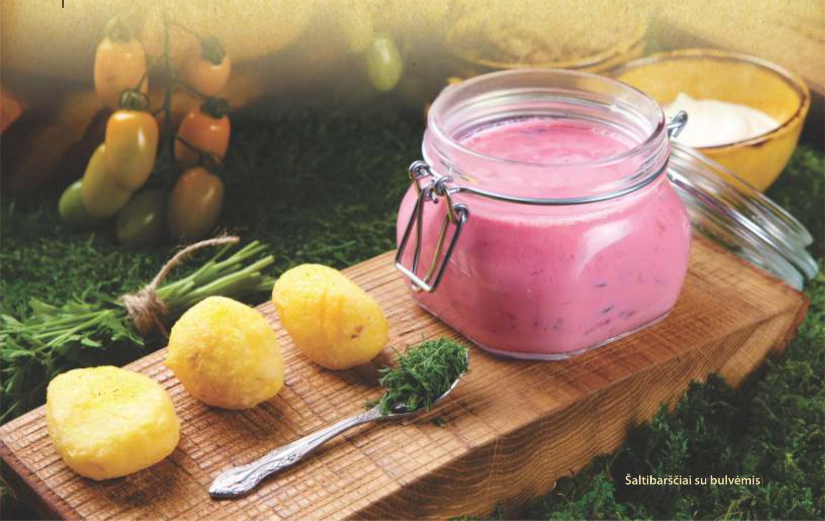
Šaltibarščiai su bulvėmis