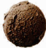
„Manjari“ šokolado ledai Manjari chocolate