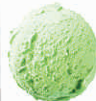
sicilietiški pistacijų ledai sicilian pistachio