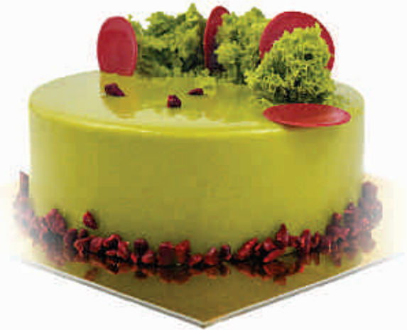
pistacijų ir aviečių pistachio & raspberry