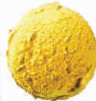
„Alphonso“ mango šerbetas Alphonse mango