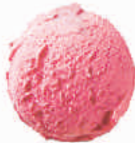
pieniški braškiniai ledai strawberry & cream