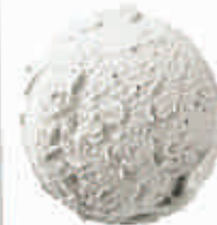
Madagaskaro vanilės ledai Madagascar vanilla