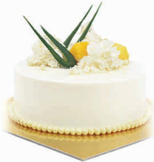
mangų ir sūrio kremo mango & cream cheese