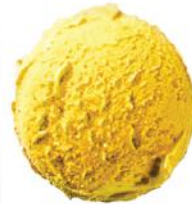
Alphonso mango šerbetas Alphonse mango