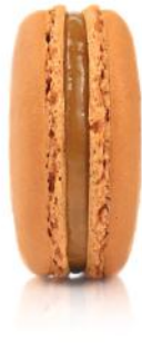
sūdytos karamelės salted caramel