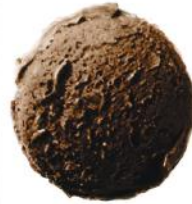
Manjari šokolado ledai MANJARI chocolate