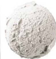
Madagaskaro vanilės ledai Madagascar vanilla