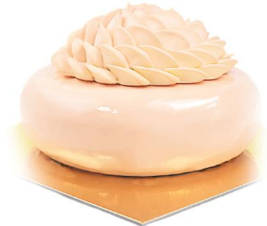
Yuzu ir žemuogių yuzu & wild strawberry