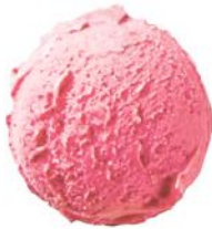
pieniški braškiniai ledai strawberry & cream