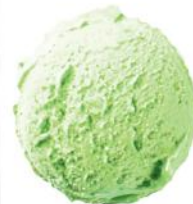
sicilietiški pistacijų ledai sicilian pistachio