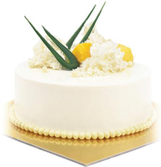
mango ir sūrio kremo mango & cream cheese