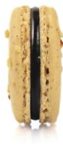
lazdynų riešutų hazelnut