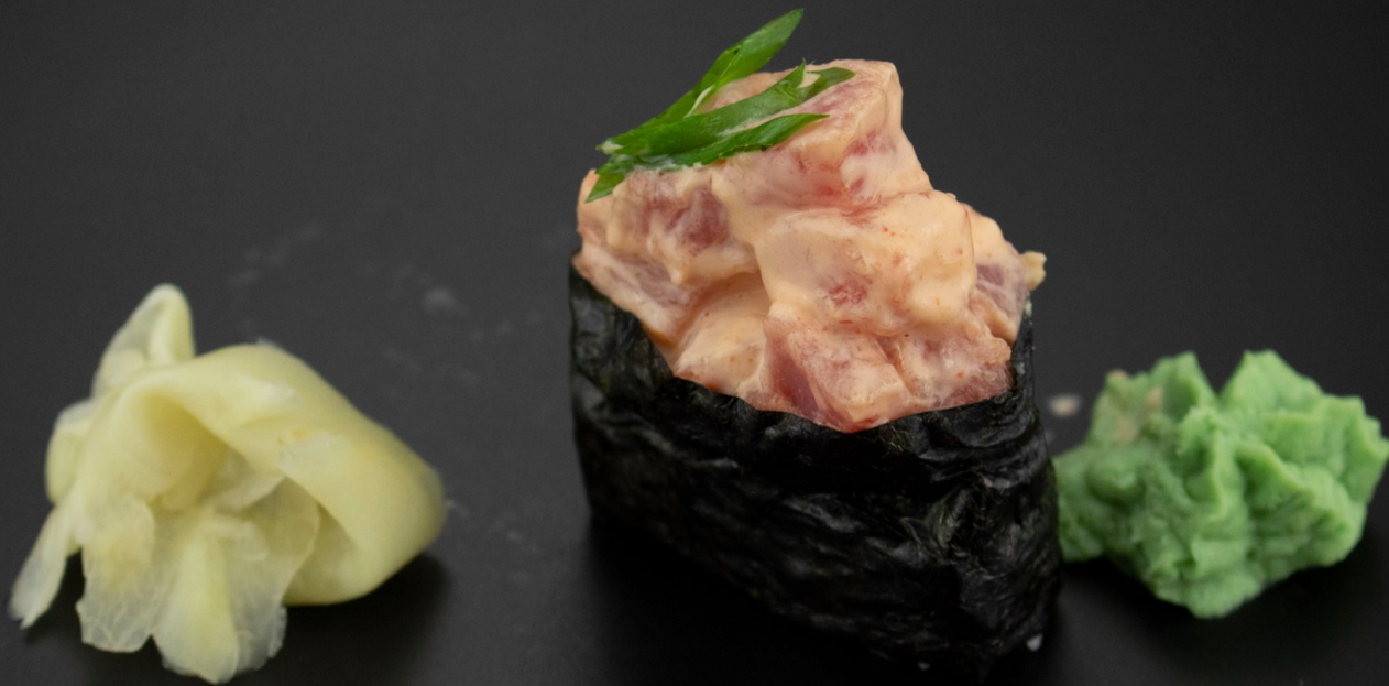
2. SPICY MAGURO GUNKAN (1vnt.) Ryžiai, nori lapas, tunas, aštrus padažas. 2,40€