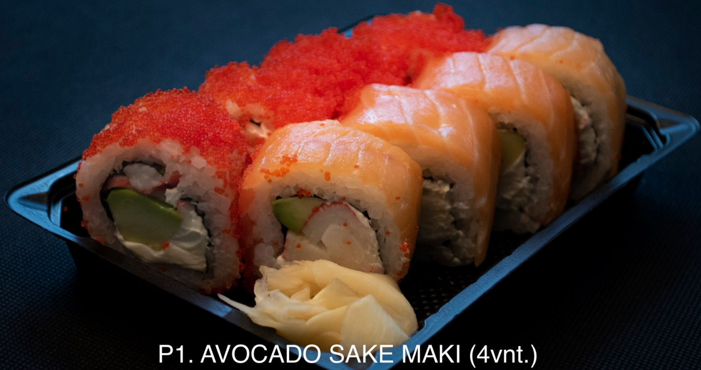
P1. AVOCADO SAKE MAKI (4vnt.) KAEMPFERI MAKI (4vnt.) 5,90€