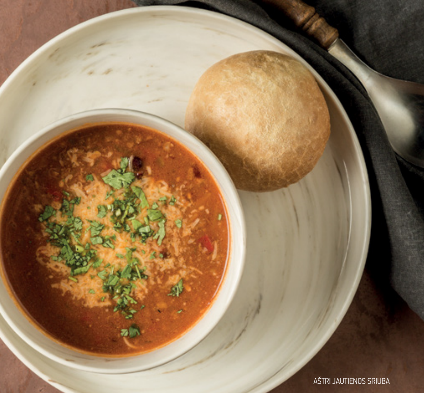
AŠTRI JAUTIENOS SRIUBA