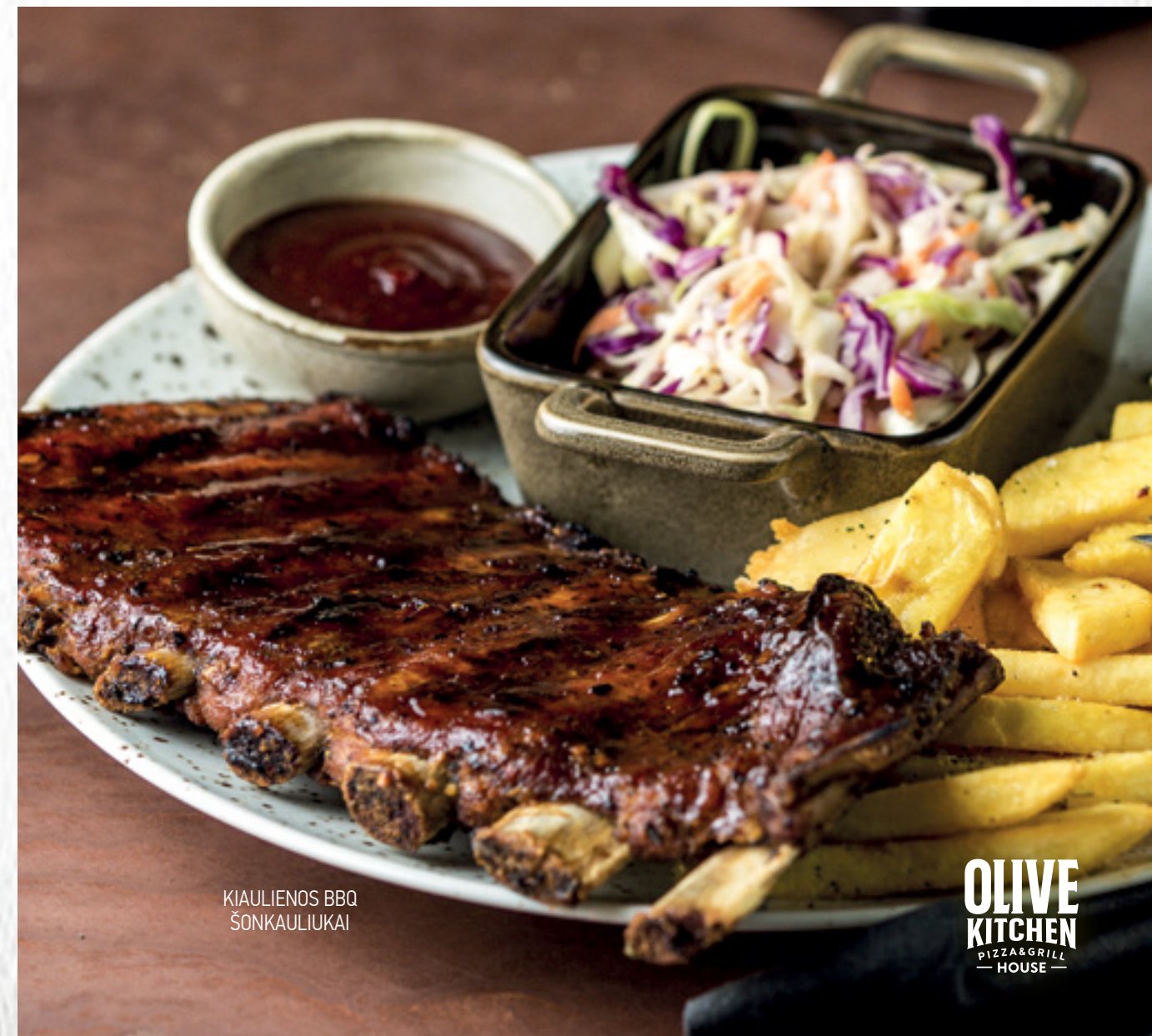
KIAULIENOS BBQ ŠONKAULIUKAI