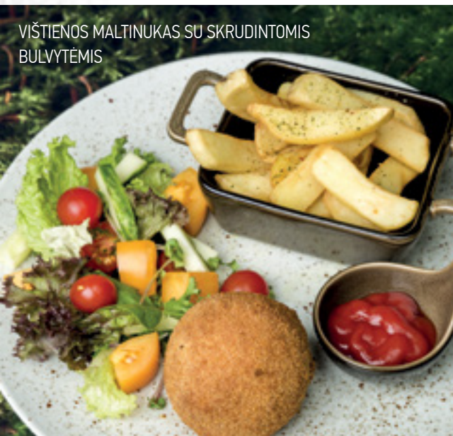
VIŠTIENOS MALTINUKAS SU SKRUDINTOMIS BULVYTĖMIS