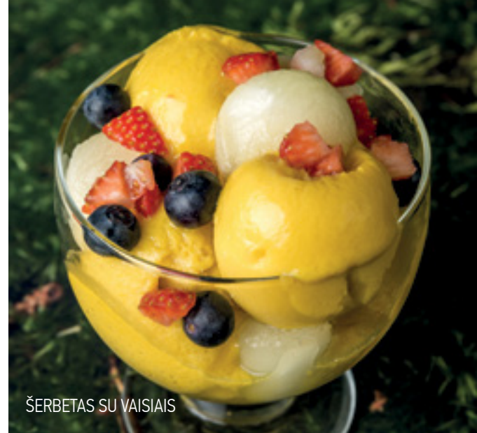
ŠERBETAS SU VAISIAIS