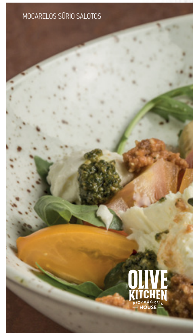
MOCARELOS SŪRIO SALOTOS