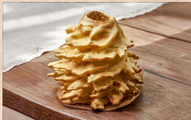
ORIGINALUS ŠAKOTIS, 1 KG