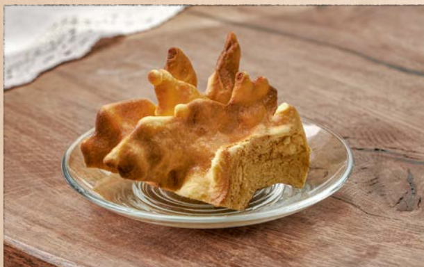
ORIGINALUS ŠAKOTIS, 100 G